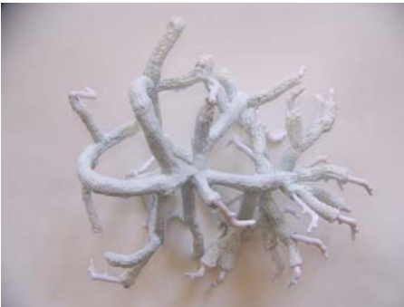
Bleu-Hydre Cire, silicone, tricot, résine,