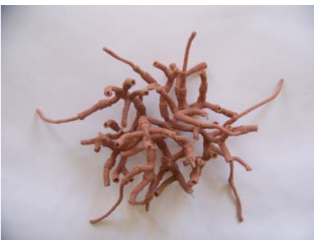
Hydre soufflé Silicone, tricot