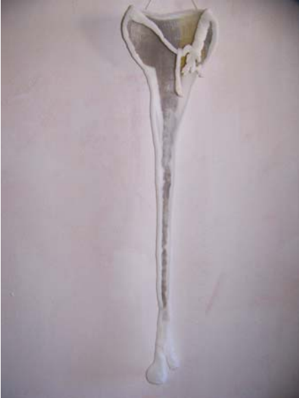
Percébés Silicone, polyamide, tissu, ivoire